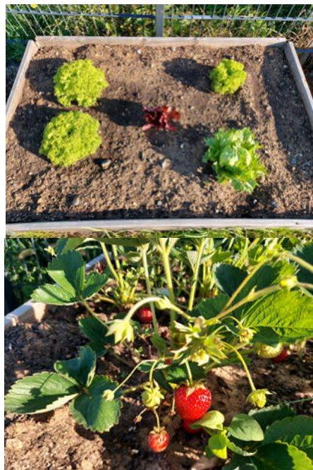
In den Hochbeeten im Garten des Philippus-Kinderhauses gedeihen Salat, Erdbeeren und andere Leckereien. Sie werden in der Küche direkt für die Kinder zubereitet.

Glücklicherweise durften in den letzten Wochen in diesem Kinderhausjahr wieder alle Kinder die Einrichtung besuchen. Wir sind sehr froh, dass wir dieses außergewöhnliche Jahr gemeinsam beenden können. Während aus der Krippe Kinder in den Kindergarten wechseln und jetzt viele neue Kinder mit ihren Familien zu uns gestoßen sind, heißt es im Kindergarten auch Abschied nehmen: 15 Delfine (Vorschulkinder) genießen die letzten Tage bei uns, nach den Sommerferien geht es dann auf der anderen Seite des Zaunes weiter. Wir wünschen ihnen einen tollen und gelungenen Start in die Schulzeit mit vielen frohen Begegnungen.